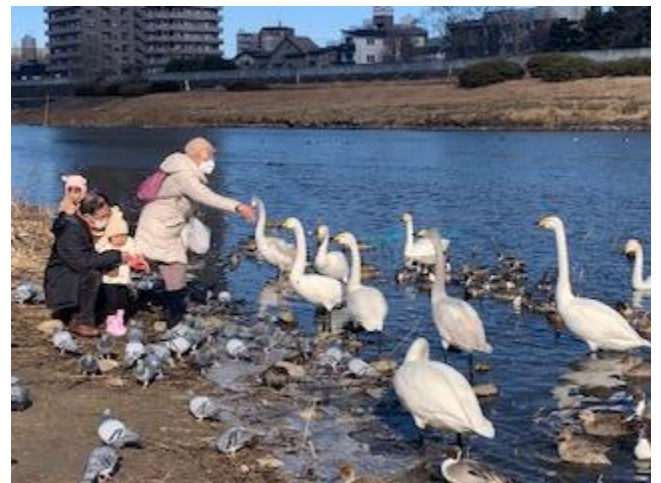
市民とオオハクチョウ/広瀬橋上流右岸 2022/1/5

定期清掃年間10回(1~2月休会)一般参加可・河川清掃・観察(五感で感じる魅力発見) 河川法による河川管理(治水・利水・環境)について学び、市民協働の川づくりを目指します 活動概要/毎月第2土曜日/清掃活動(地域貢献証明発行)詳細はHpを参照下さい 会員募集(個人会員/年会費5千円・法人会員/年会費1万円)