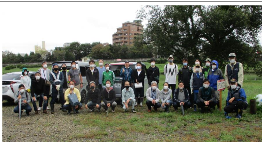
清掃活動(郡山堰~J R新幹線鉄橋(10/9))

12/11(土)10:00~ 同上 ※)マスク、手袋、長靴持参でご参加下さい。(ヒバサミも)