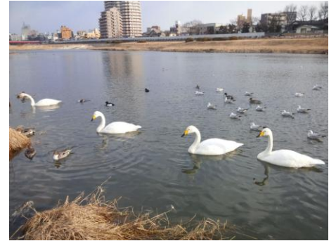
広瀬橋上流のオオハクチョウ 3/02

早くも2年目の3. 11災害日を迎えます。未曾有の被害は未だに修復されず、復旧復興も困難を極め、当事者には多大な苦労が強いられています。先日夜9時NHK特集番組の報道で、震災被害に対する専門的な検証によって様々な課題が明らかになりました。その中で、重要なことは情報を元とした個人の判断と行動が生死を分けると報じました。当然できると思っていることができない災害、脆弱さ。それに対する私たちの日常の暮らし方、そして防災に対する社会のあり方について考えさせられました。